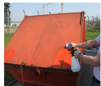
Entrostung / Flugrostentfernung